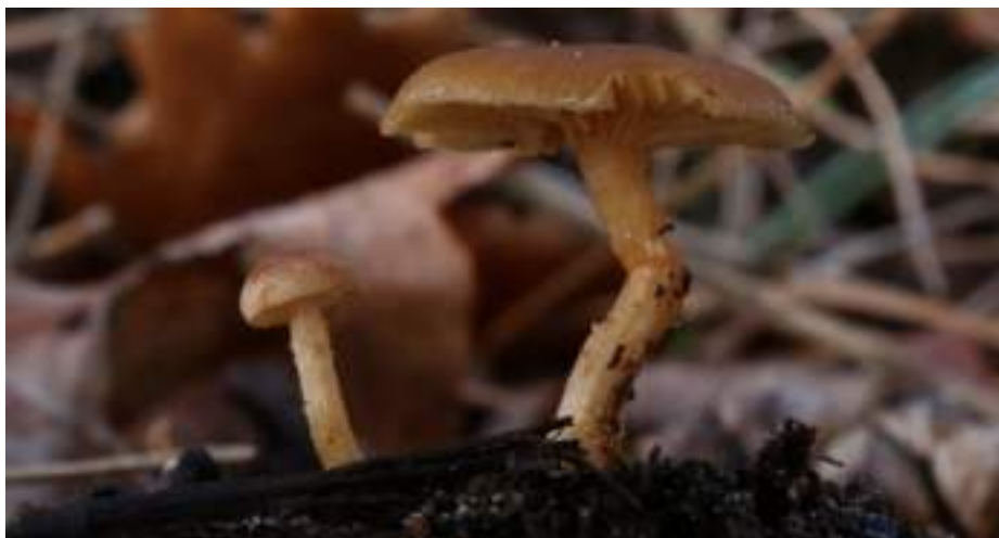
Naaldbosmosklokje ( Galerina sideroides )

Geastrum fimbriatum - Gewimperde aardster