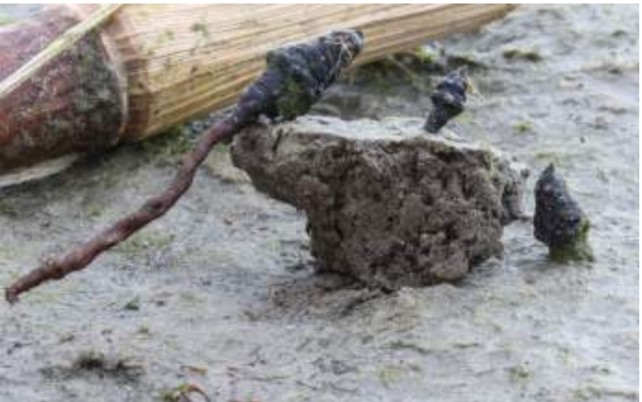
Langgesteeld vruchtlichaam van Podosordaria pedunculata