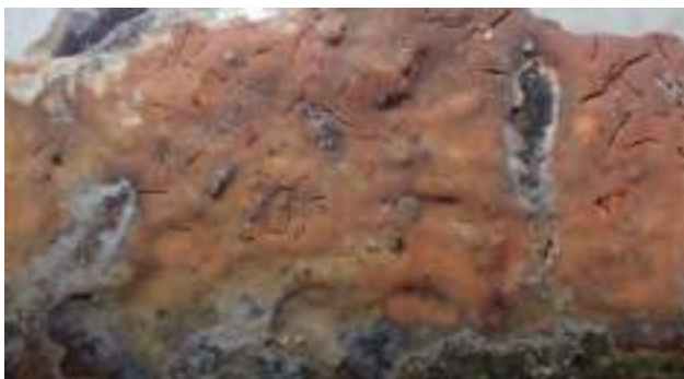
Bonte schorszwam ( Peniophora pseudo- versicolor )