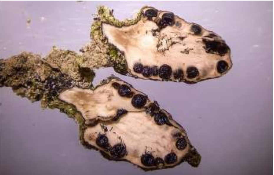
Doorsnede vruchtlichaam P. pedunculata