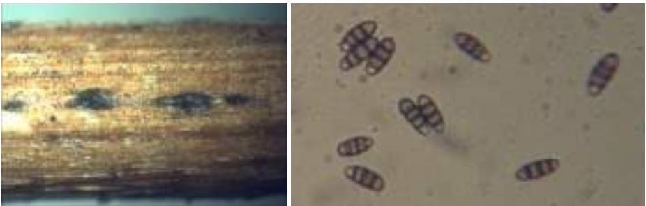
Sporocadus rosigena , links vruchtlichamen x30, rechts conidia x400

Fomitiporia hippophaeicola - Duindoornvuurzwam Peniophora lycii - Berijpte schorszwam Ascobolus roseopurpurascens - Wijnrood spikkelschijfje Hysterium angustatum - Schorsspleetkooltje Hysterium pulicare - Loofbosspleetkooltje Hysterobrevium mori - Muursporig spleetkooltje Lamprospora retispora - IMazenmosschijfje Lasiobolus equinus Lasiosphaeris hirsuta - Harig ruigkogeltje Patellaria atrata - Foprouwschotelkje Thelebolus crustaceus - Oker sinterklaasschijfje Dictyochaeta fertilis Diplodia rubi Illosporiosis christiansenii Lylea tetracoila Nemaniam serpens - Grijskorstkogelzwam Septocytia ruborum Sporocadus rosigena Xanthoriicola physciae Lycoperdon lividum - Melige stuifzwam Tulostoma brumale - Gesteelde stuifbal Dacrymyces stillatus - Oranje druppelzwam Tremella mesenterica - Gele trilzwam