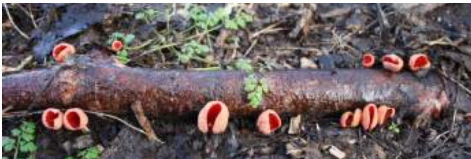
Krulhaarkelkzwam ( Sarcoscypha austriaca )

Sarcoscypha austriaca - Krulhaarkelkzwam