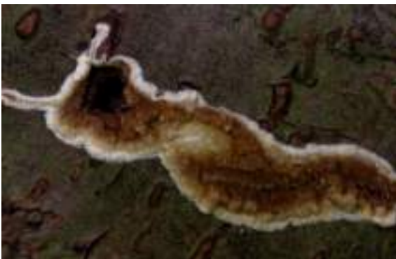
Dikke kelderzwam ( Coniophora puteana )