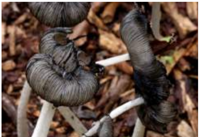
Hazenpootje ( Coprinopsis lagopus ) (foto's: W. Slosse)