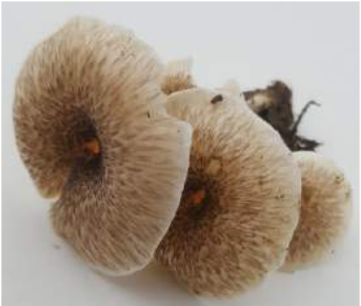
Tijgertaaiplaat ( Lentinus tigrinus )