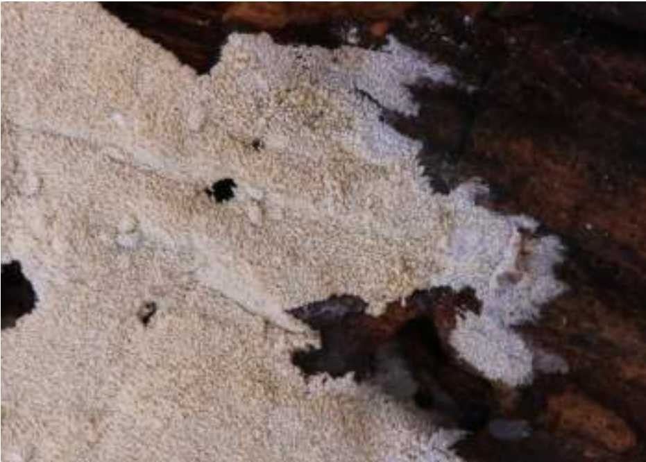
Muizentandkorstje ( Fibrodontia gossypina )

Deze mooie soort verdient zeker een verhoogde aandacht van de (amateur-)mycologen temeer daar Fibrodontia gossypina mits wat oefening en KOH toch redelijk goed te determineren valt.