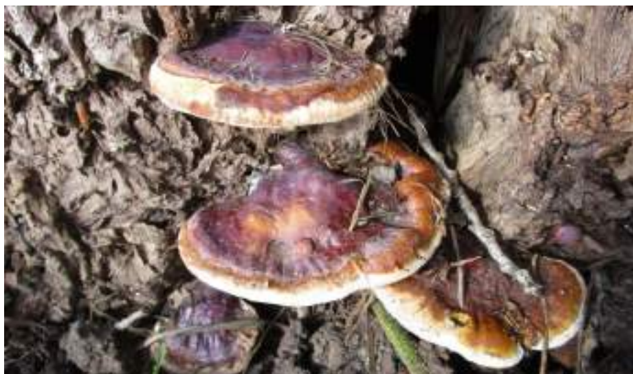
Harslakzwam ( Ganoderma resinaceum )