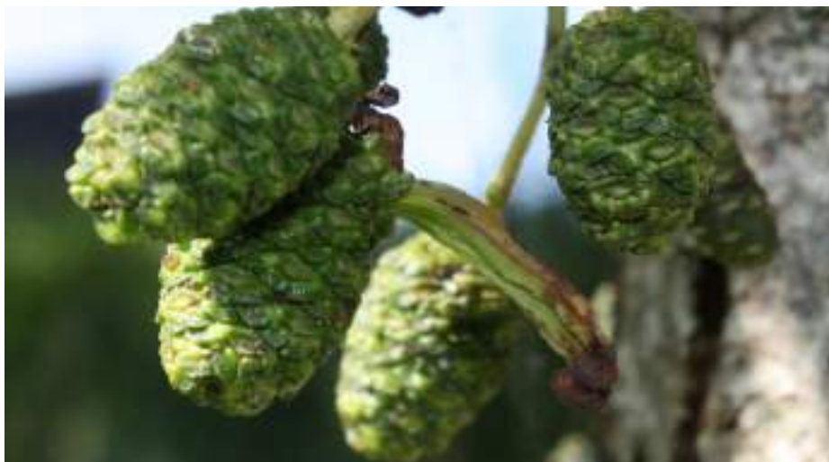
Elzenvlag ( Taphrina alni )