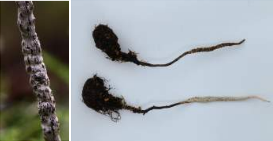
Meidoornbesgeweizwam ( Xylaria oxyacanthae ), detail vruchtlichaam en twee vruchtlichamen op Sleedoornpitten