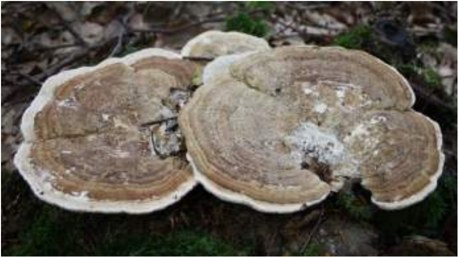
Doolhofzwam ( Daedalea quercina )