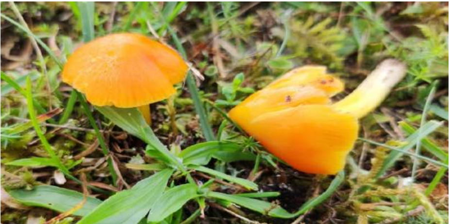
Puntmutswasplaat ( Hygrocybe acutoconica )