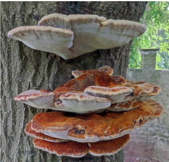
Ruige weerschijnzwam ( Inonotus hispidus )