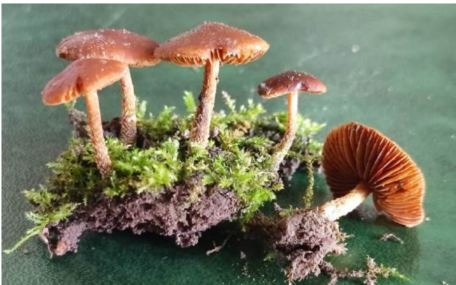
Roestbruin vloksteeltje ( Flammulaster ferrugineus )