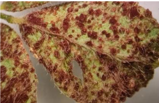
Cipreswolfsmelk- vlinderbloemenroest ( Uromyces pisi-sativi )

Uromyces pisi-sativi - Cipreswolfsmelk-vlinderbloemenroest