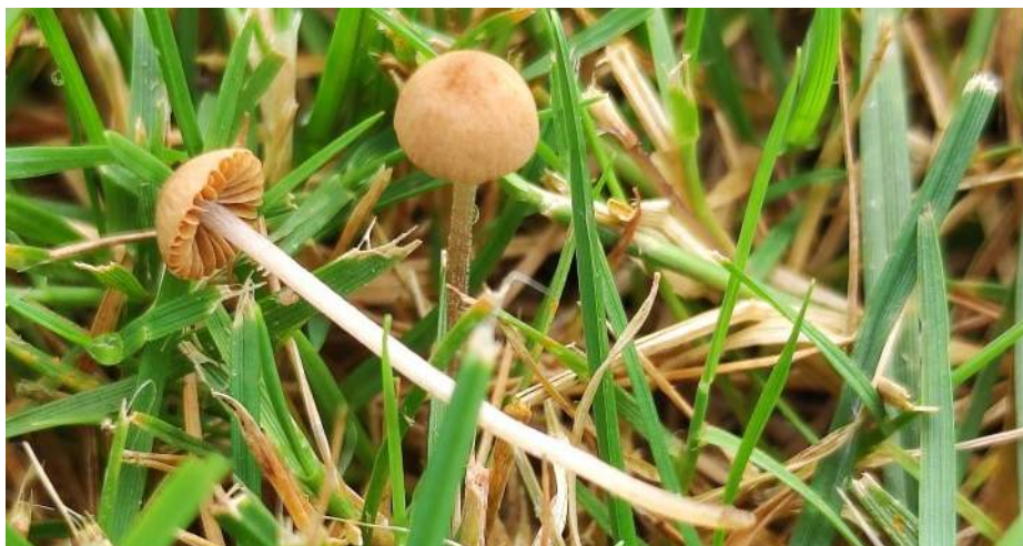
Oker breeksteeltje ( Conocybe ochrostriata )