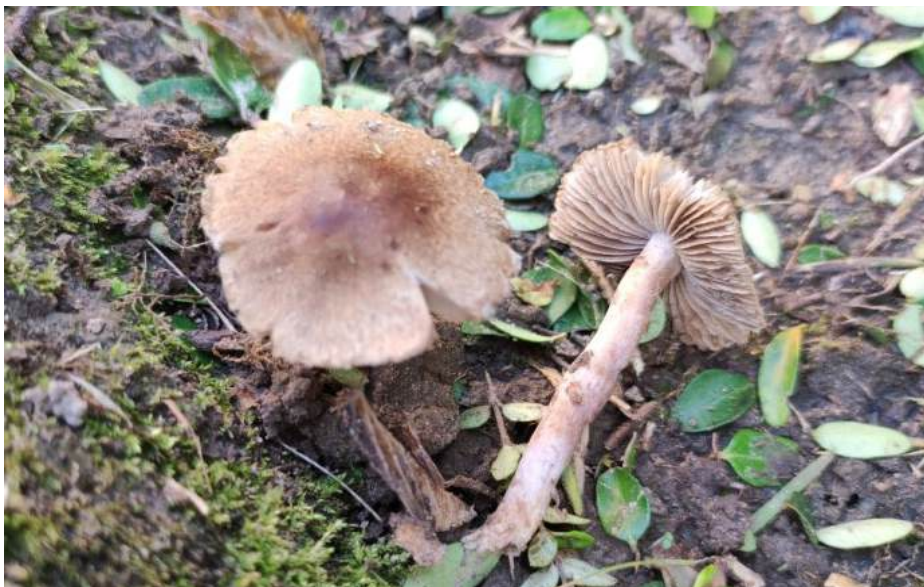
Sombere vezelkop ( Inocybe fuscidula )