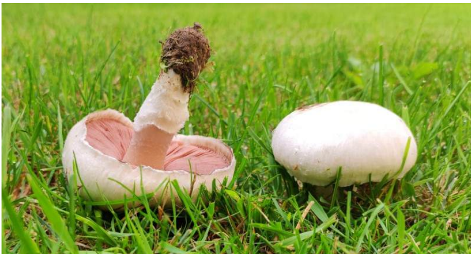
Gewone weidechampignon ( Agaricus campestris )

Flammulaster ferrugineus - Roestbruin vloksteeltje (foto onderaan) Inocybe fuscidula - Sombere vezelkop (foto p.63) Parasola plicatilis s.l. - Plooirokje s.l.