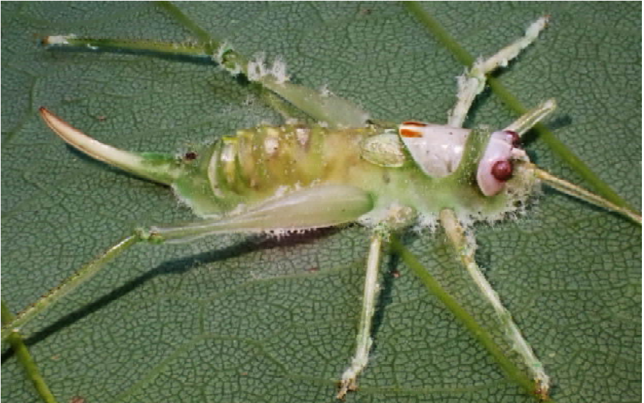
Entomophaga grylli