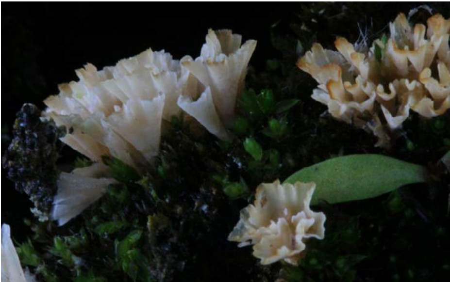
Franjekorsttrechttertje ( Cotylidia undulata )