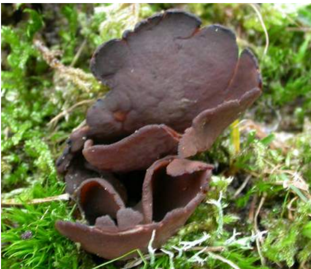
Donker hazenoor ( Otidea bufonia )