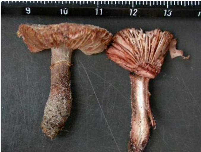
Foto 3. Doorsnede van de Zandparasolzwam, één dag na plukken