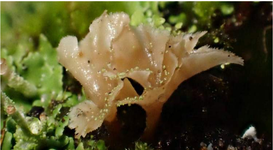
Franjekorsttrechttertje ( Cotylidia undulata)