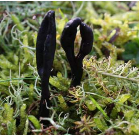
Ruige aardtong ( Trichoglossum hirsutum )