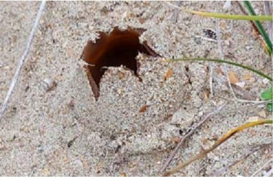
Zandtulpje ( Peziza ammophila )