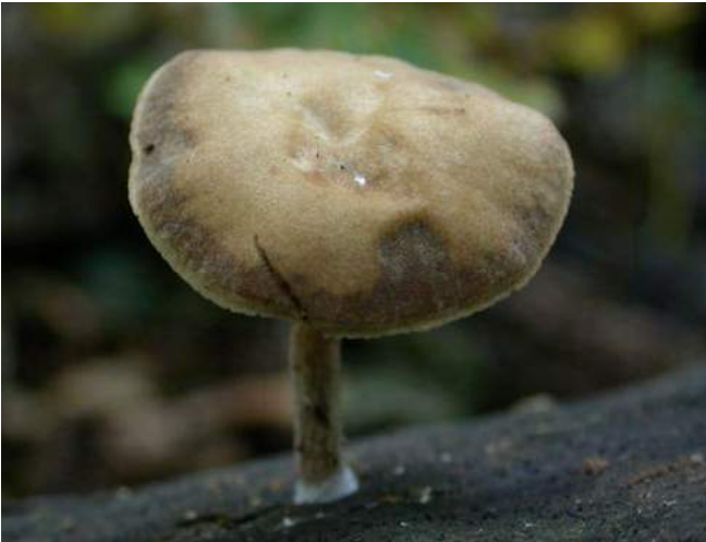
Donkere leemhoed ( Agrocybe firma )

Hymenoscyphus rokebyensis - Wit beukendopvlieskelkje