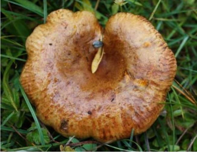
Grote krulzoom ( Paxillus ammoniavirescens )

Auricularia auricula-judae - Echt judasoor Dacrymyces stillatus - Oranje druppelzwam Tremella mesenterica - Gele trilzwam Phragmidium bulbosum - Papilbraamroest