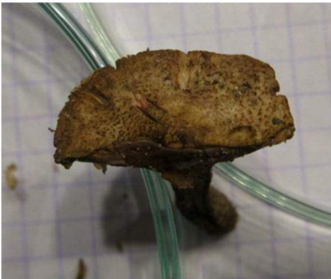
Foto 4. Bovenaanzicht van de Zandparasolzwam, bij thuiskomst