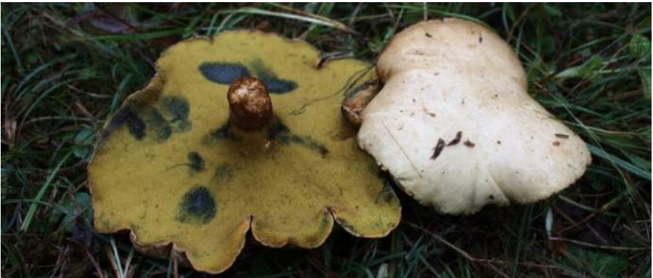
Elzenboleet ( Gyrodon lividus )