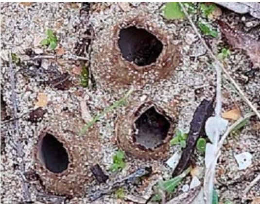
Zandputje ( Geopora arenicola )

Chondrostereum purpureum - Paarse korstzwam Peniophora lycii - Berijpte schorszwam Phlebia radiata - Oranje aderzwam Trametes pubescens - Fluweelelfenbankje Xylodon raduloides - Valse tandzwam Xylodon sambuci - Witte vlierschorszwam Geopora arenicola - Zandputje (Foto onderaan) Amarenomyces ammophilae - Helmgrasvulkaantje Hymenoscyphus robustior - Rietvlieskelkje Hysterium angustatum - Schorsspleetkooltje Lamprospora retispora - Mazenmosschijfje Patellaria atrata - Foprouwschotelkje Peziza ammophila - Zandtulpje (Foto p. 86) Ruzenia spermoides - Stronkruigkogeltje Illosporiopsis christiansenii Montagnula perforans Phoma ammophilae Phomatospora dinemasporium Cyathus olla - Bleek nestzwammetje Tulostoma brumale - Gesteelde stuifbal Auricularia auricula-judae - Echt judasoor Cumminsia mirabilissima - Mahoniaroest