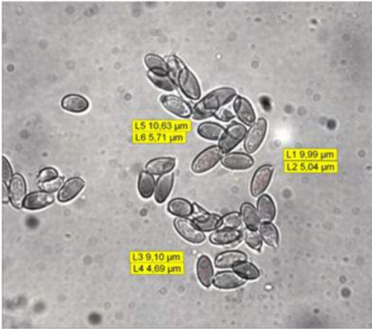
Foto 5. Sporen van de Zandparasolzwam, in Melzer

De microscopie werd verricht door Jacky Launoy en Pol Debaenst.