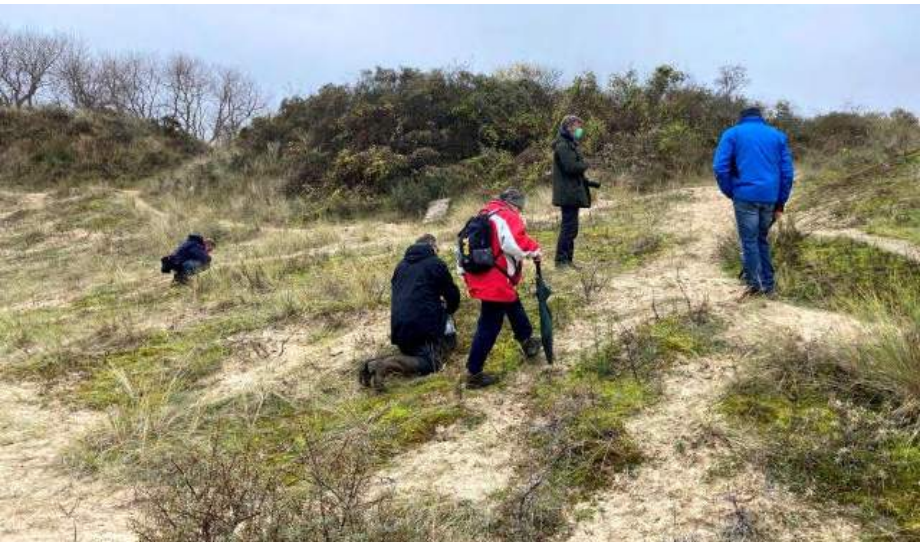
Sfeerbeeld van de excursie in de Simli-duinen: enkele deelnemers zijn druk in de weer op zoek naar paddenstoelen.