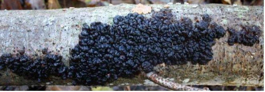
Zwarte trilzwam ( Exidia nigricans )

Clitocybe barbularum - Duinmostrechterzwam